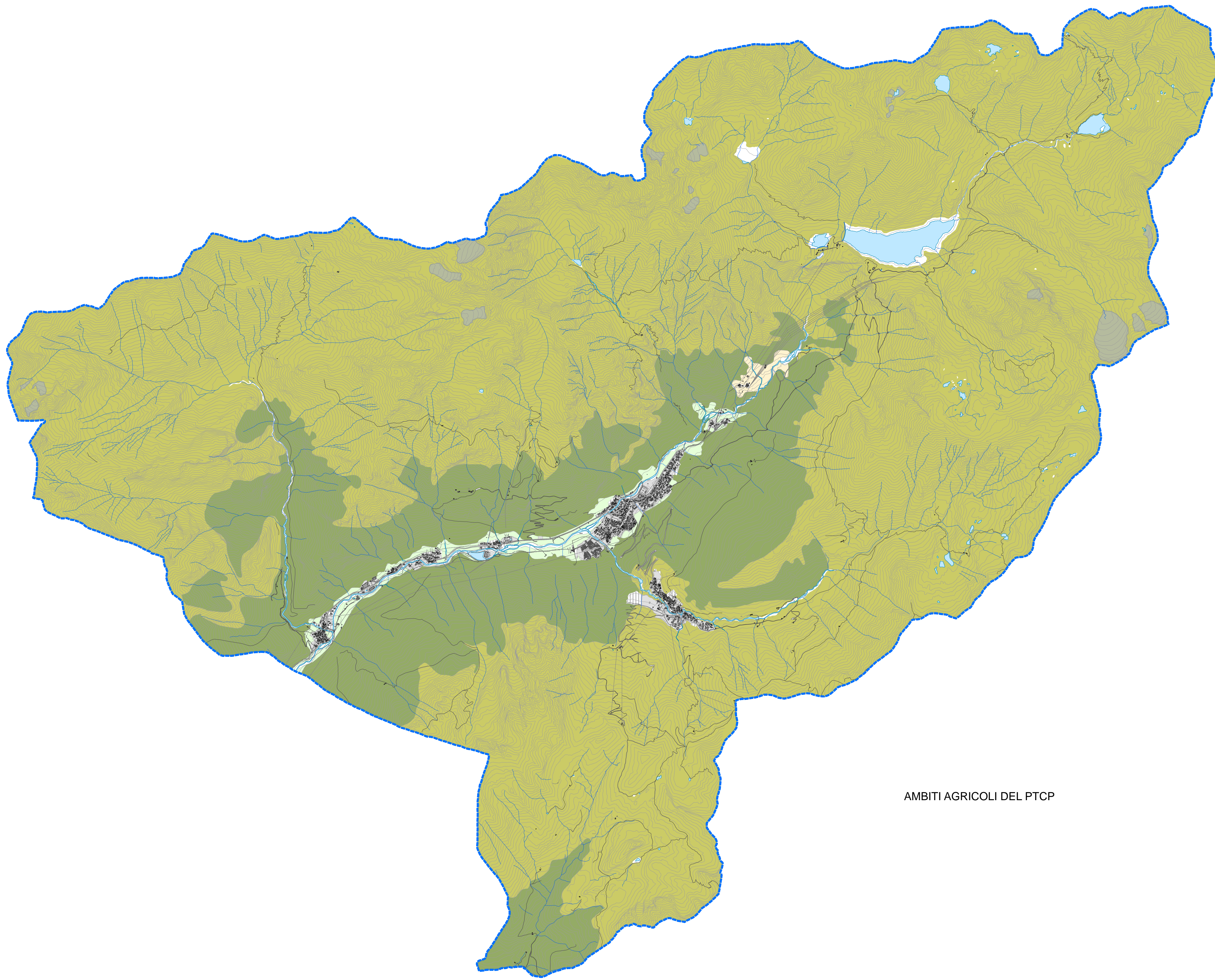
AMBITI AGRICOLI DEL PTCP