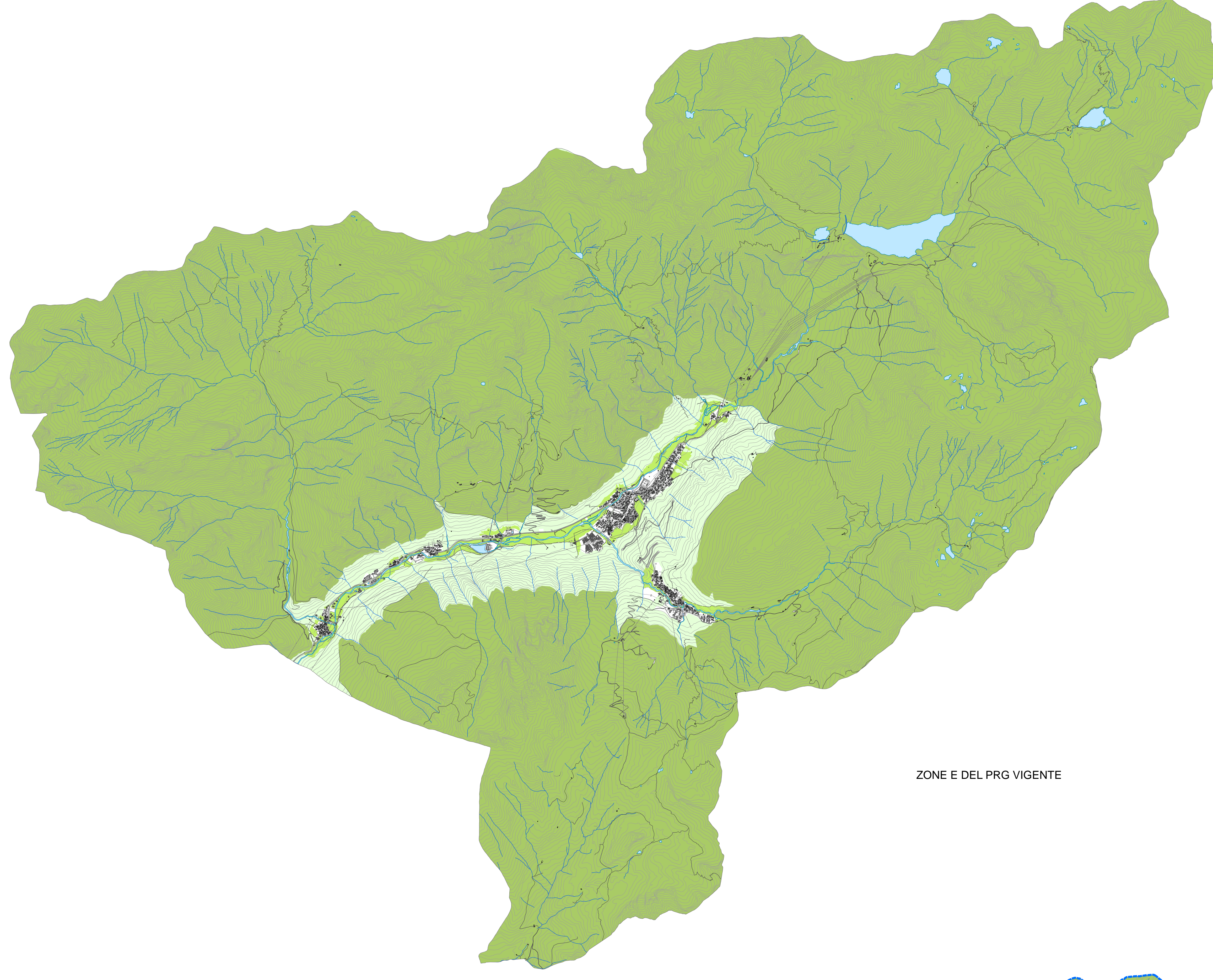
ZONE E DEL PRG VIGENTE